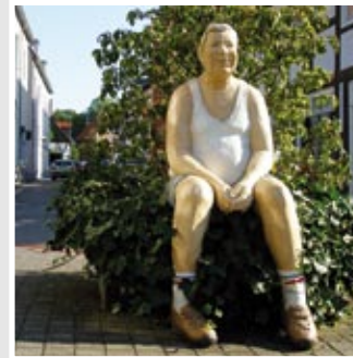
WIEDENBRÜCKER ORIGINAL, Kirchstraße