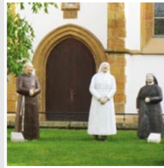
FRANZISKANER, 4 NONNEN, Marienkirche